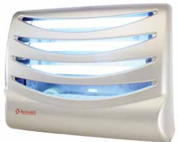
Luminos 3 Plus